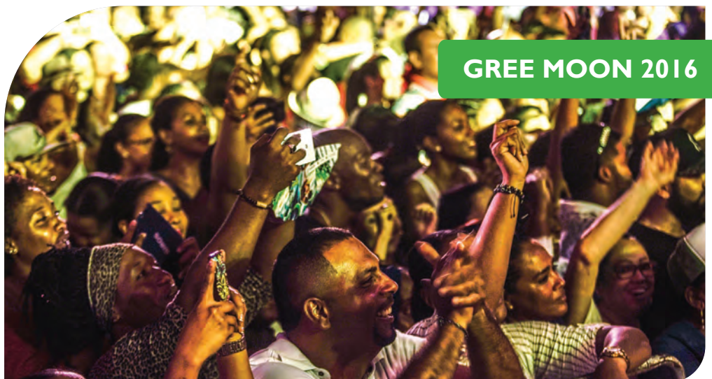
GREE MOON 2016