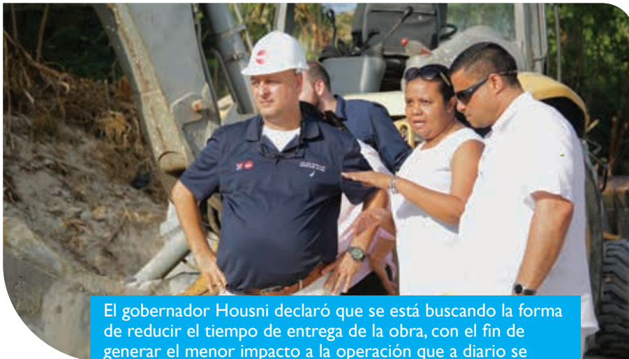
El gobernador Housni declaró que se está buscando la forma de reducir el tiempo de entrega de la obra, con el fin de generar el menor impacto a la operación que a diario se realiza en esta zona.

isleños participan en este proyecto, garantizando así el acceso a la mano de obra local.