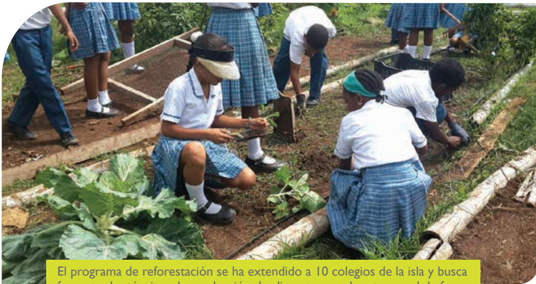
El programa de reforestación se ha extendido a 10 colegios de la isla y busca fomentar las técnicas de producción de alimentos en el sector rural de forma rentable y responsable con los entornos naturales y sociales del Archipiélago.

Secretaría de Agricultura realizó estudio para identificar beneficiarios de este programa y causas de la extinción del cocotero.