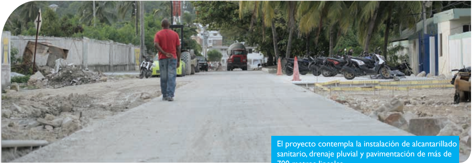
El proyecto contempla la instalación de alcantarillado sanitario, drenaje pluvial y pavimentación de más de 700 metros lineales.

La reconstrucción de la calle 16 proporcionará a la isla mayor proyección y más productividad.