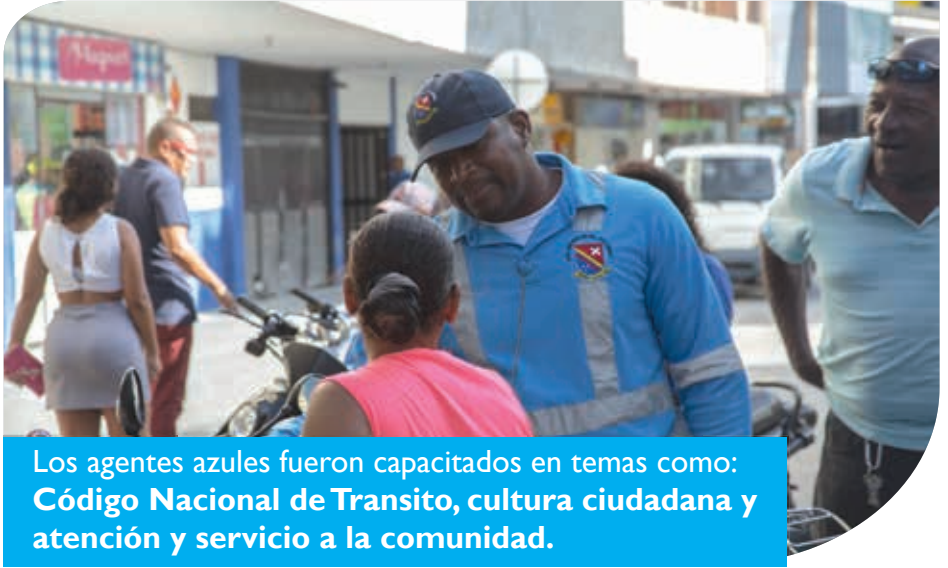
Los agentes azules fueron capacitados en temas como: Código Nacional de Transito, cultura ciudadana y atención y servicio a la comunidad.

La cultura ciudadana ha sido la clave para ordenar y mejorar la movilidad en la zona céntrica de San Andrés.