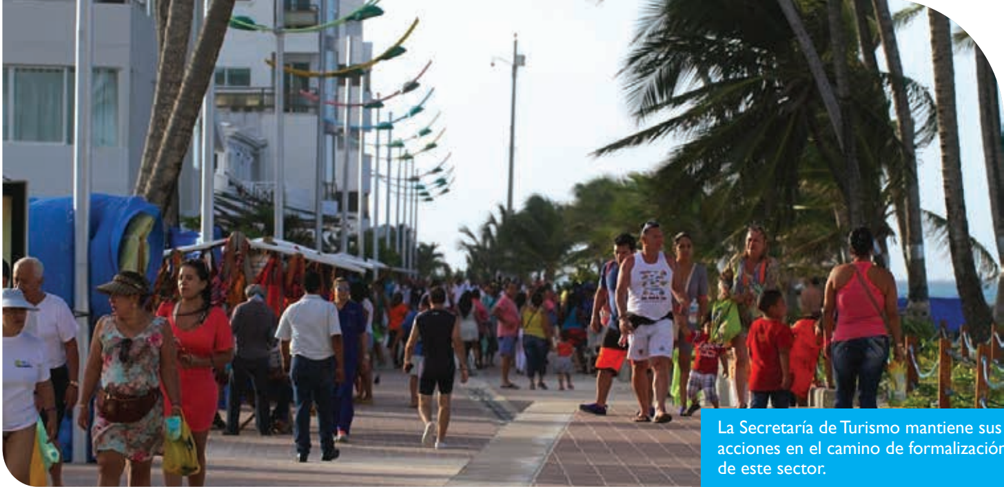
La Secretaría de Turismo mantiene sus acciones en el camino de formalización de este sector.

Secretarías de Turismo y Gobierno trabajan en conjunto con la Policía y la oficina de la Occre para articular estrategias contra la informalidad en el sector turístico.