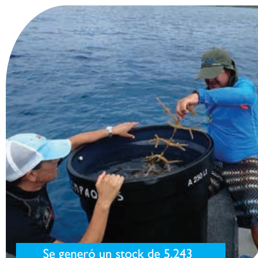
Se generó un stock de 5.243 fragmentos de nueve especies diferentes de organismos coralinos

Es importante resaltar el trabajo que, desde la Secretaría de Agricultura y Pesca se ha venido realizando de la mano con 18 pescadores artesanales que hacen parte de este proceso (13 en San Andrés y 5 en Providencia), y quienes están vinculados a través del programa BANCO2 donde reciben capacitaciones y formación técnica. Igualmente, junto con la Fundación Corales de Paz, se implementaron diferentes estrategias que han permitido identificar los factores de deterioro y el nivel de impacto directo o indirecto generadas por las diferentes actividades humanas.