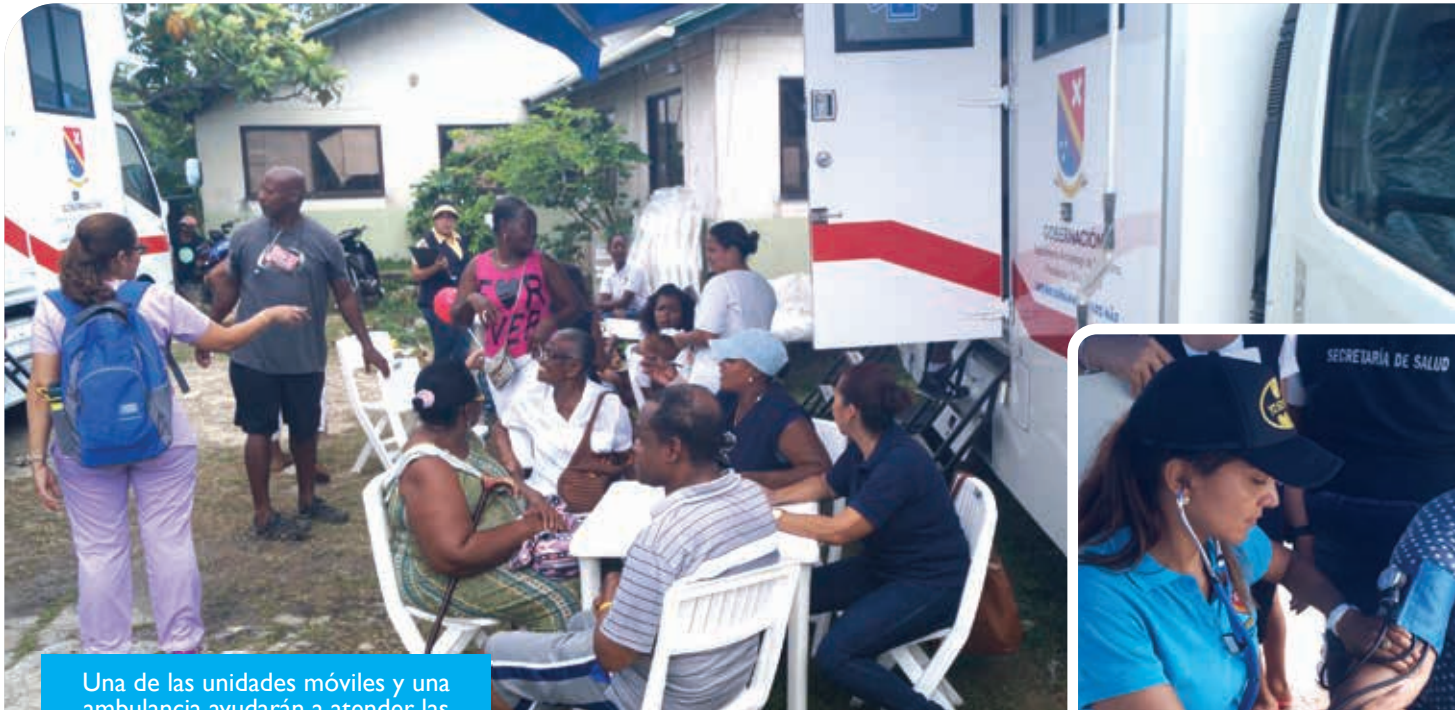
Una de las unidades móviles y una ambulancia ayudarán a atender las necesidades médicas en Providencia,