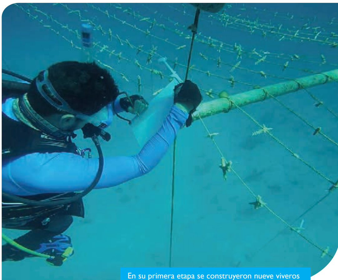
En su primera etapa se construyeron nueve viveros (siete en San Andrés y dos en Providencia)

En su primera etapa, se construyeron nueve viveros (siete en San Andrés y dos en Providencia) y se generó un stock de 5.243 fragmentos de nueve especies diferentes de organismos coralinos, incluyendo los Corales Cuerno de Ciervo y Cuerno de Venado que se encuentran en peligro crítico de extinción. Dos meses después de su primera siembra, se observa una supervivencia promedio de los fragmentos hasta en un 99% en San Andrés y 90% en la isla de Providencia.