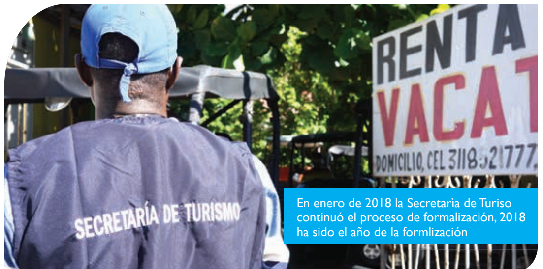
En enero de 2018 la Secretaría de Turismo continuó el proceso de formalización, 2018 ha sido el año de la formalización