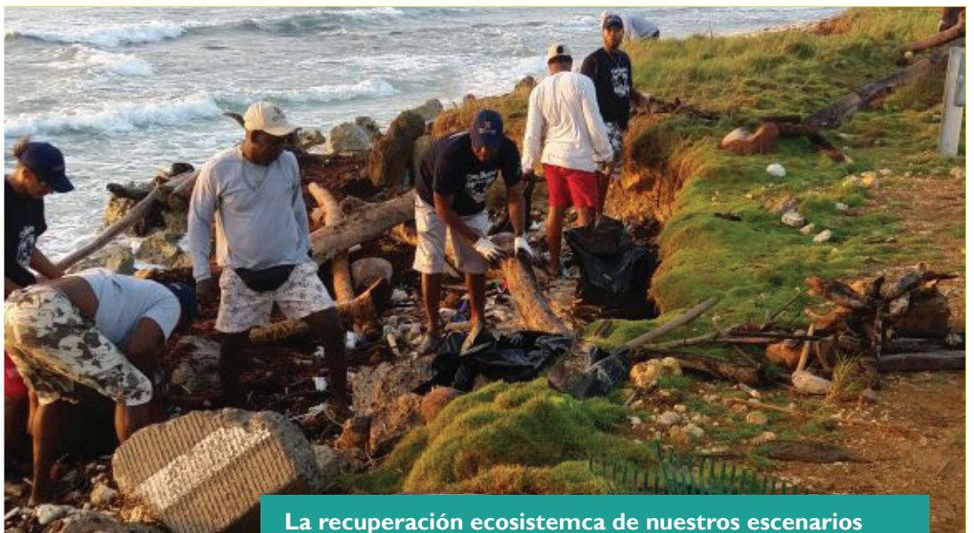
La recuperación ecosistemica de nuestros escenarios naturales y turísticos debe ser un compromiso de todos.

Seguridad ante todo Junto con la Policía Nacional en el Departamento se llevó a cabo el lanzamiento del plan garantizar y al mismo tiempo implementar programas de seguridad turística para reducir el riesgo de los visitantes.