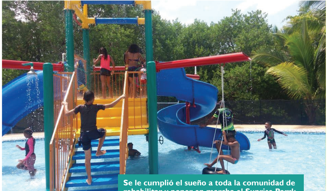
Se le cumplió el sueño a toda la comunidad de rehabilitar y poner en marcha el Sunrise Parrk.