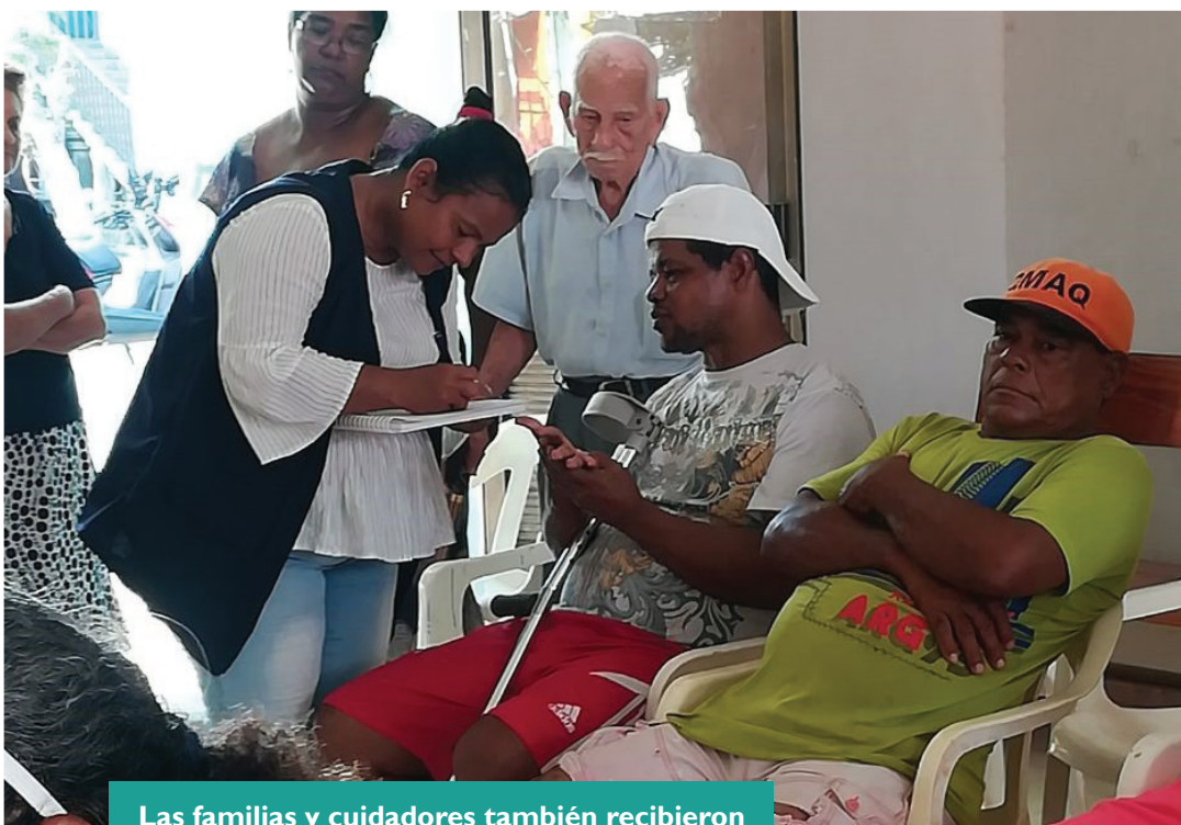
Las familias y cuidadores también recibieron acompañamiento integral

Durante las dos etapas de esta estrategia se realizaron talleres sobre los derechos de las personas en discapacidad, charlas motivacionales y actividades de recreación y esparcimiento.