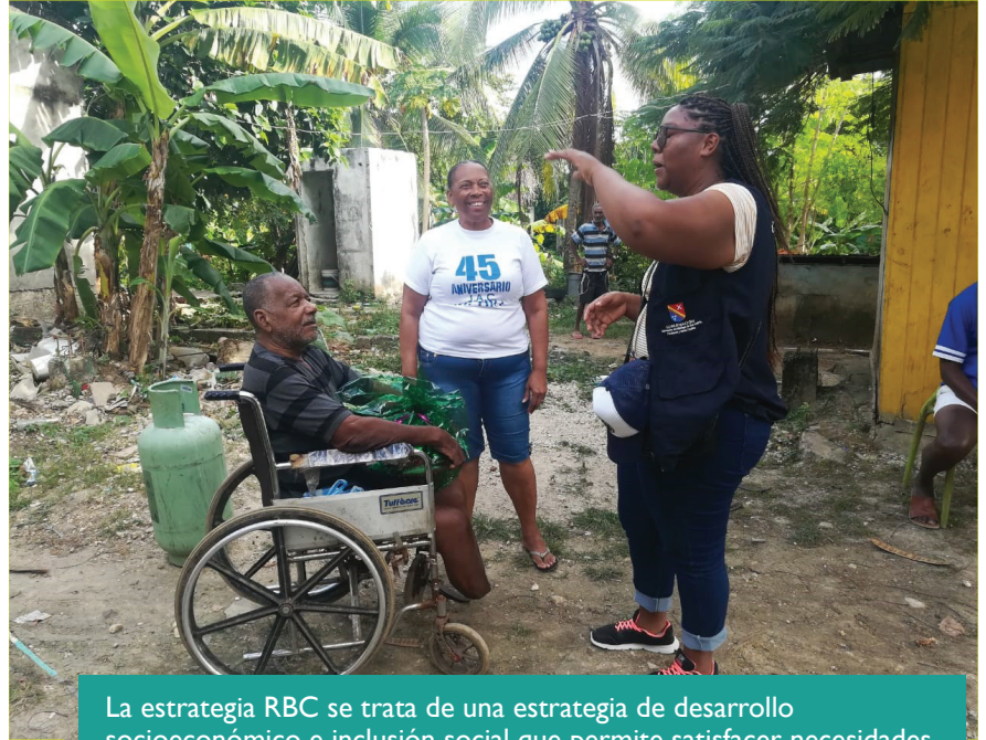
La estrategia RBC se trata de una estrategia de desarrollo socioeconómico e inclusión social que permite satisfacer necesidades básicas y crear oportunidades con las organizaciones de personas con discapacidad y grupos de apoyo.

En 2018 la Secretaría de Desarrollo Social del Archipiélago de San Andrés Providencia y Santa Catalina, a través de los programas Raizal y Discapacidad le apostaron al rescate de la unión de las familias isleñas.