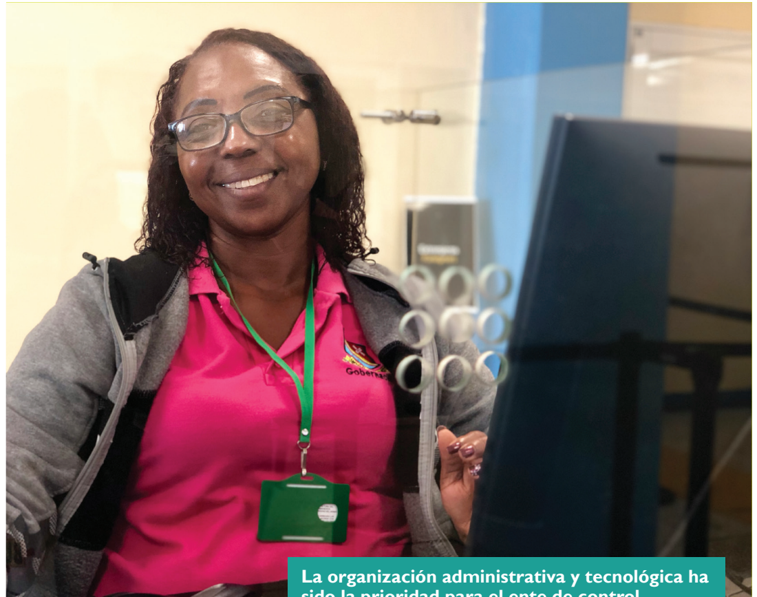
La organización administrativa y tecnológica ha sido la prioridad para el ente de control.