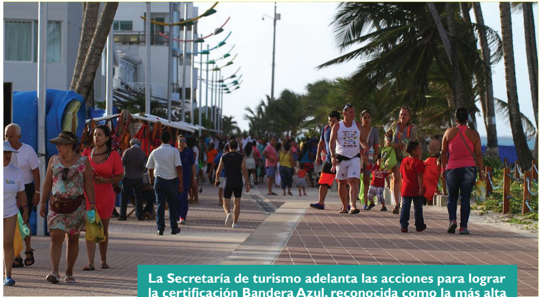
La Secretaría de turismo adelanta las acciones para lograr la certificación Bandera Azul , reconocida como la más alta eco-etiqueta de calidad ambiental.

En conjunto con la Secretaría de Servicios Públicos y Medio Ambiente, la cartera de Turismo realizó mantenimiento y recolección de residuos en los balnearios del sur de la isla y en Ros y Haynes Cay.