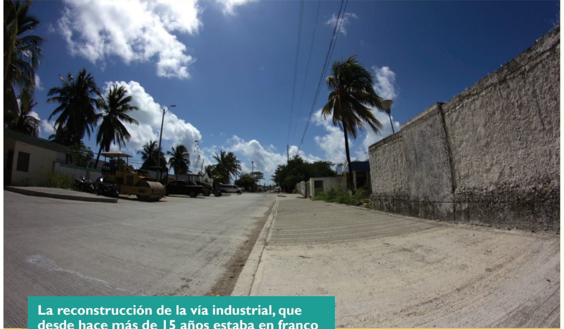
La reconstrucción de la vía industrial, que desde hace más de 15 años estaba en franco deterioro, hoy se encuentra en fase final.

2018 fue un año fructífero en materia de infraestructura de calidad para las islas en el que se realizaron se pusieron diferentes obras de construcción, adecuación y mantenimiento del patrimonio público esencial para la prestación de servicios de salud, educativos, tecnológicos, públicos y domiciliarios que se prestan en el departamento.