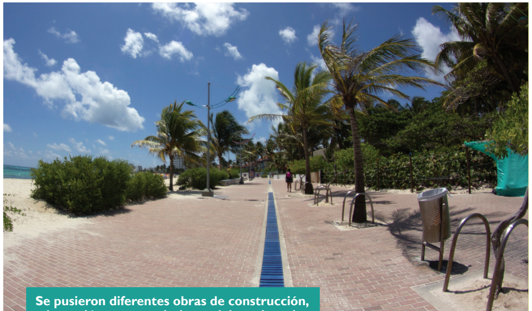
Se pusieron diferentes obras de construcción, adecuación y mantenimiento del patrimonio público esencial.