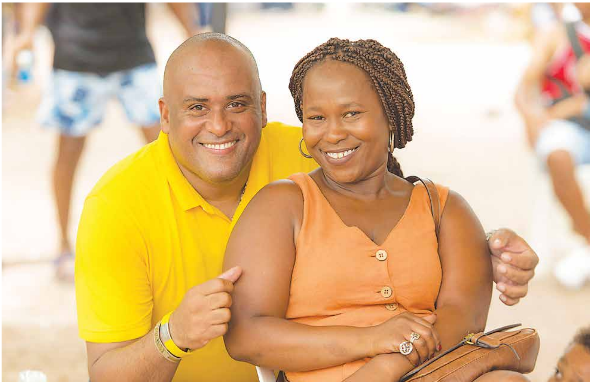
Las mujeres víctimas de la violencia y todas en general, tendrán un lugar especial en el gobierno de Hawkins / Foto prensa / Everth Hawkins.

Apoyar mediante procesos de inversión racional y pertinente el desarrollo de una política económica que propenda a la satisfacción de las necesidades básicas de la comunidad, el mejoramiento de sus ingresos económicos y el fortalecimiento de su desarrollo social en armonía con el ecosistema, para lo cual se mejorará la infraestructura vial con un mayor esfuerzo en la red vial terciaria, la infraestructura productiva como elemento indispensable para una mayor calidad en la producción agropecuaria, manufacturera, industrial, turística, cultural y de servicios, el acceso a servicios públicos con calidad y permanencia, la formalización de la propiedad como elemento dinamizador de la economía y punto de acceso al crédito, el apoyo a los pequeños y medianos empresarios.