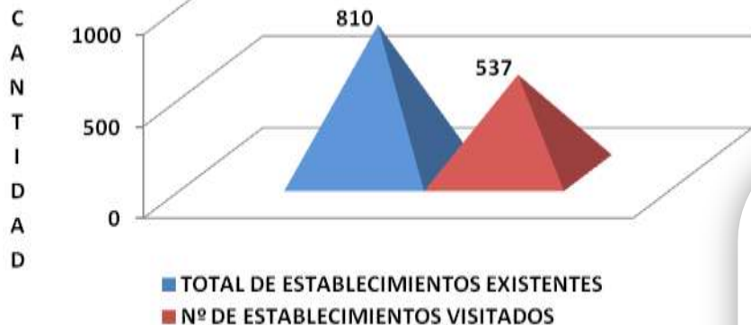
Gafica 1. VISITAS DE INSPECCION SANITARIA ESTABLECIMIENTOS DE ALIMENTOS 2009

DEL TOTAL DE ESTABLECIMIENTOS EXISTENTES (810) SE PROGRAMARON PARA EL AÑO 2009 405