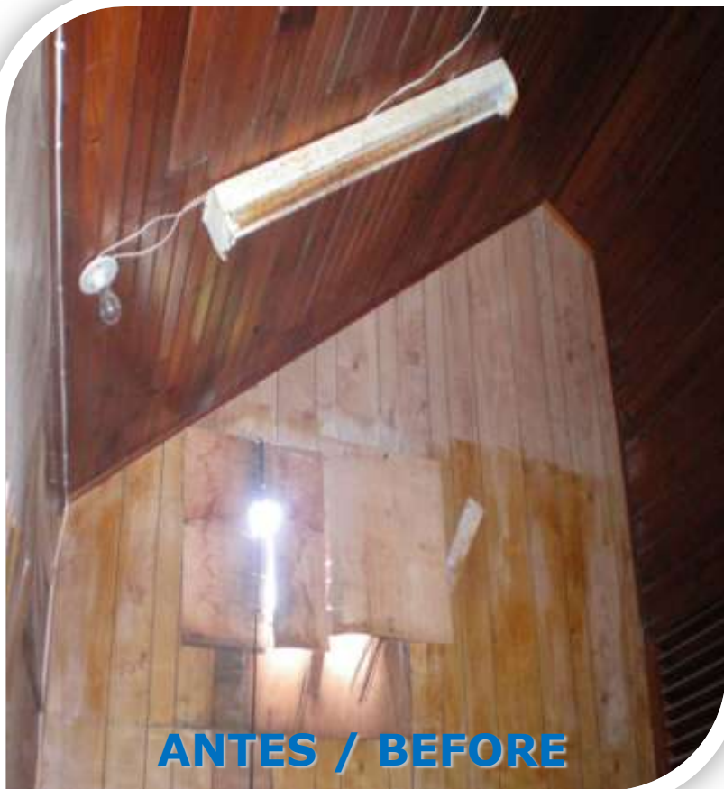
ANTES / BEFORE