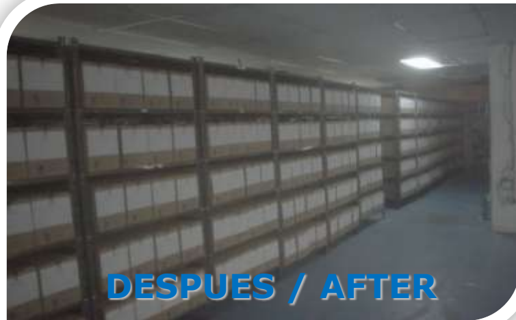
DESPUES / AFTER