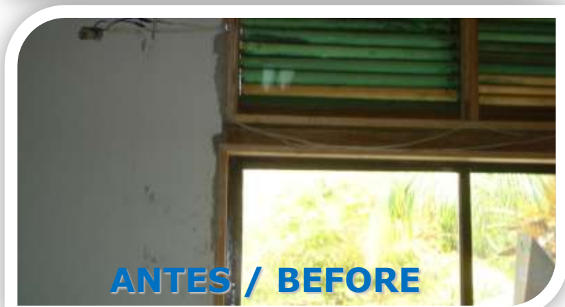
ANTES / BEFORE