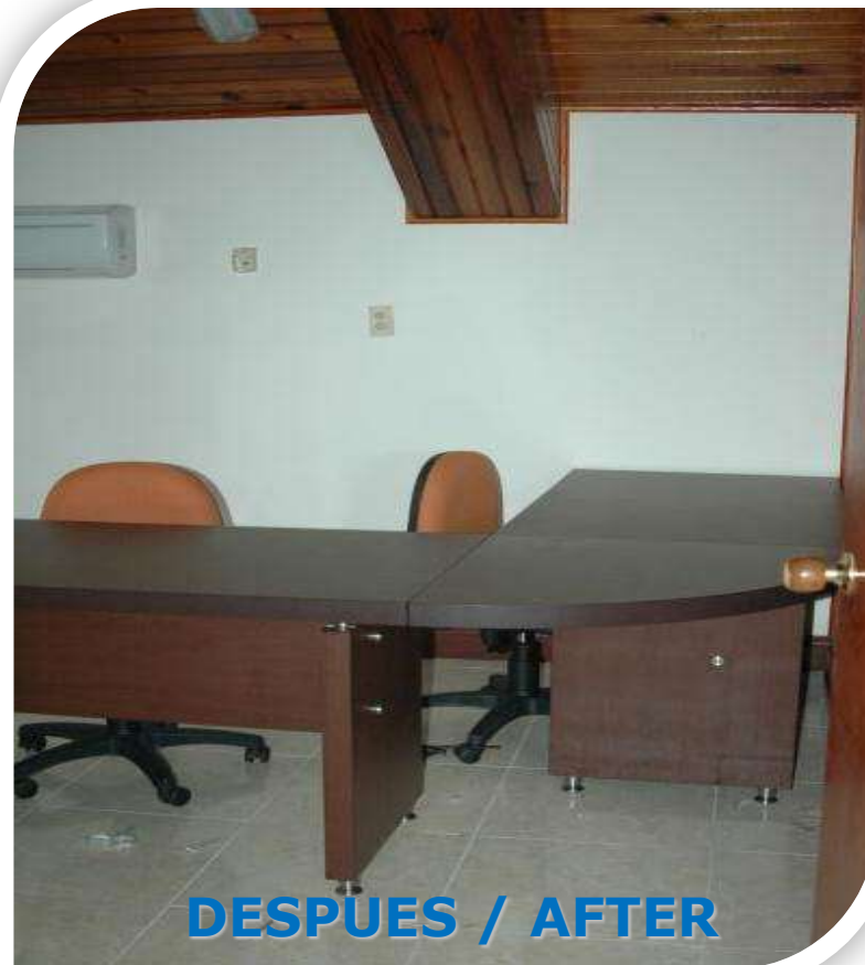
DESPUES / AFTER