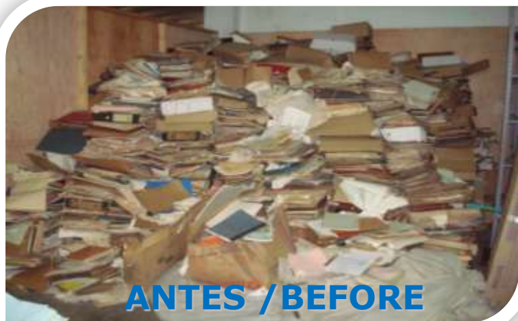
ANTES / BEFORE

840 linear meters of documents were adequately organized belonging to the Accumulated Documentary Fund from the Departmental Administration.