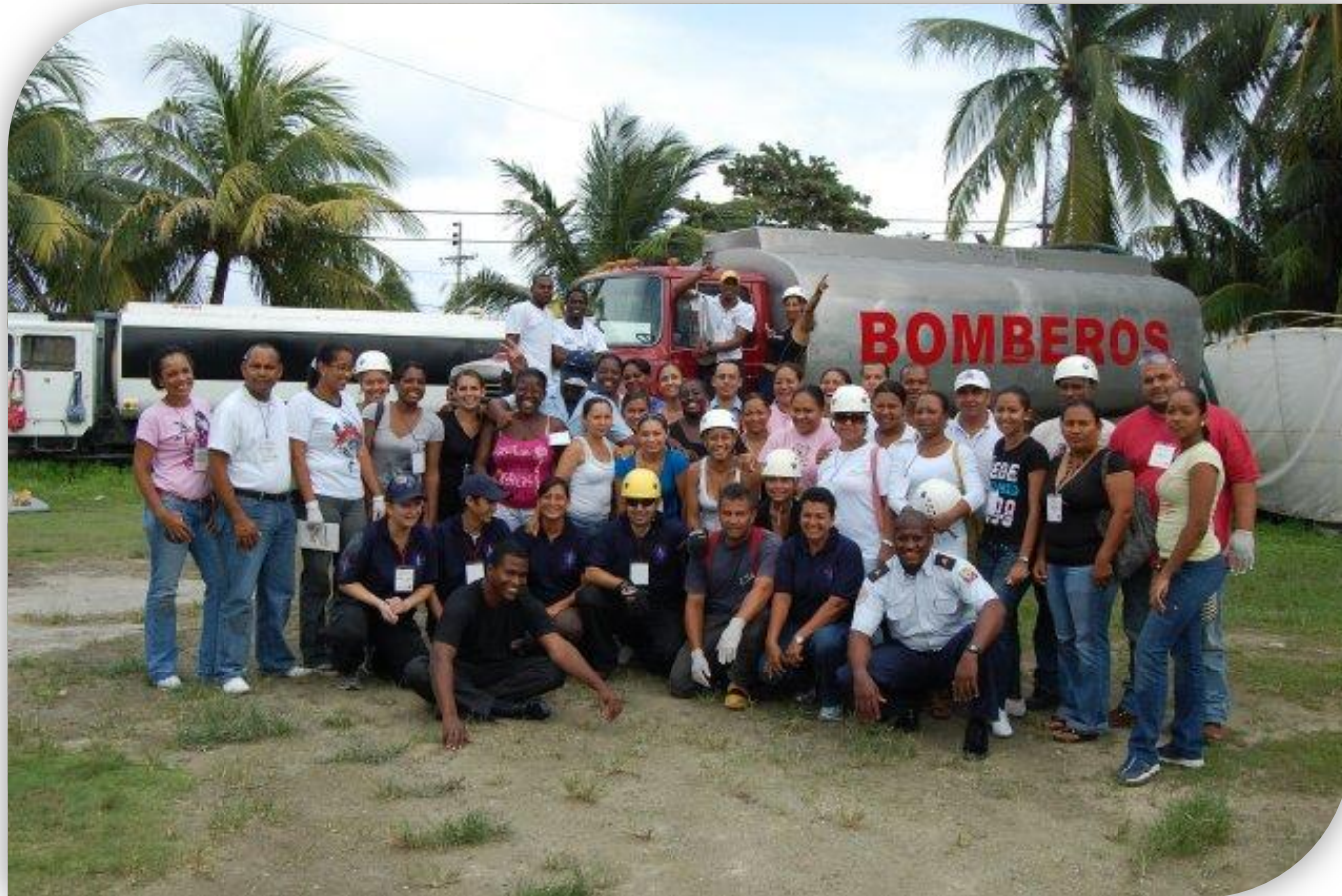
8 ejercicios de práctica institucional.