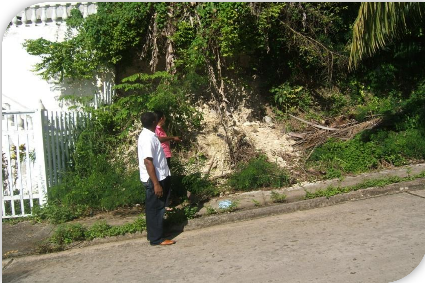
Análisis de Riesgo al Talud del barrio el Bight