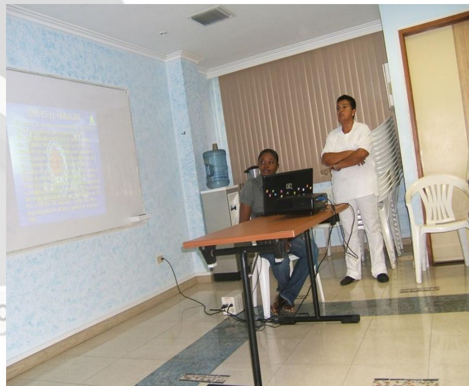
Ponente del tema :Cuba Organizado por CORALINA. Capacitadas 20 personas