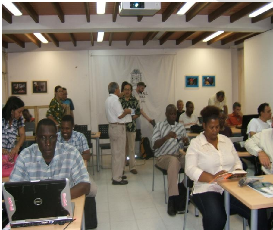
Taller sobre la Gestión del Riesgo organizado por la Universidad Nacional y el S.N.P.A.D. Invitadas (35) personas de las islas del Caribe.