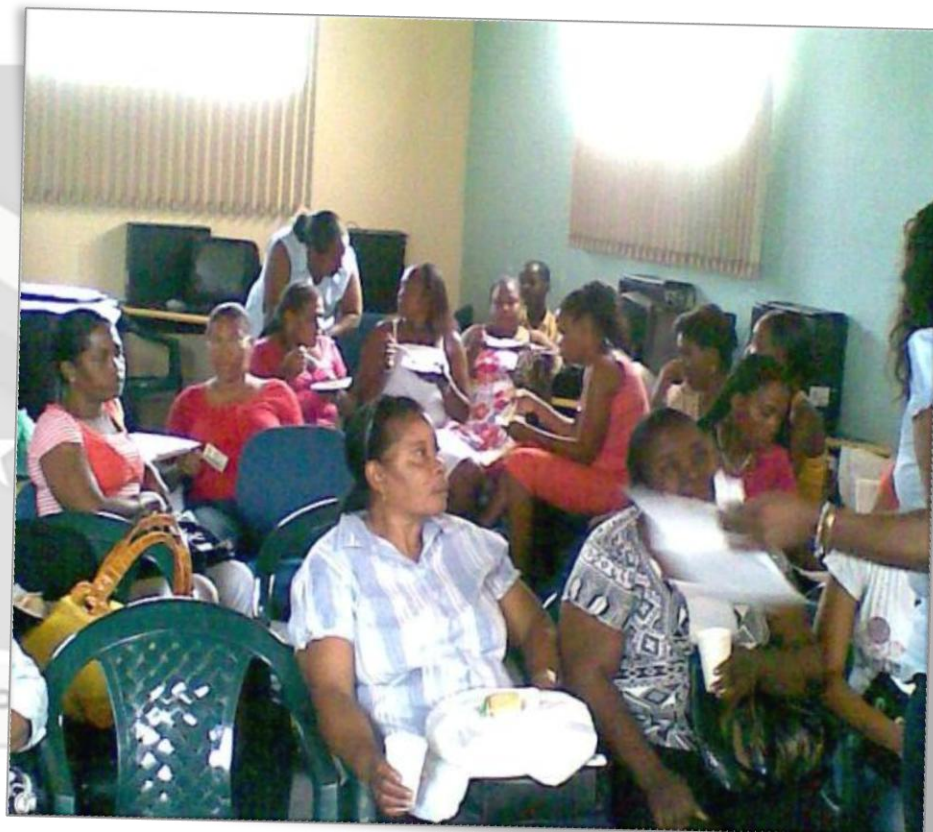
Participación directa de Rectores y Docentes de Preescolar, Primaria y Secundaria.