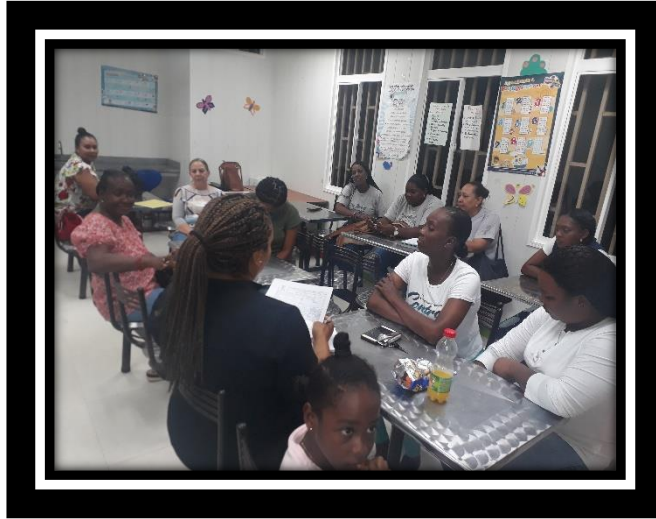
SOCIALIZACIÓN INICIO DE OBRA “RENOVACIÓN DE REDES DE ACUEDUCTO” SECTOR BARKERS HILL