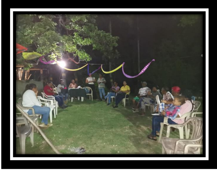
SOCIALIZACIÓN INICIO DE OBRA” RENOVACIÓN DE REDES DE ACUEDUCTO” SECTOR FLOWERS HILL