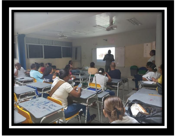
MESA DE TRABAJO VEEDORES COMUNITARIOS COVE