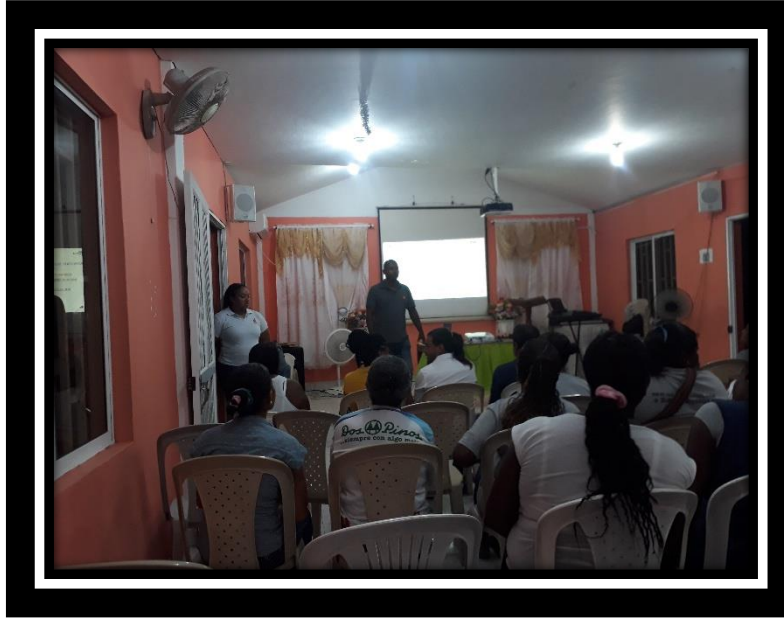
SOCIALIZACIÓN INICIO DE OBRA “RENOVACIÓN DE REDES DE ACUEDUCTO” SECTOR PERRY HILL