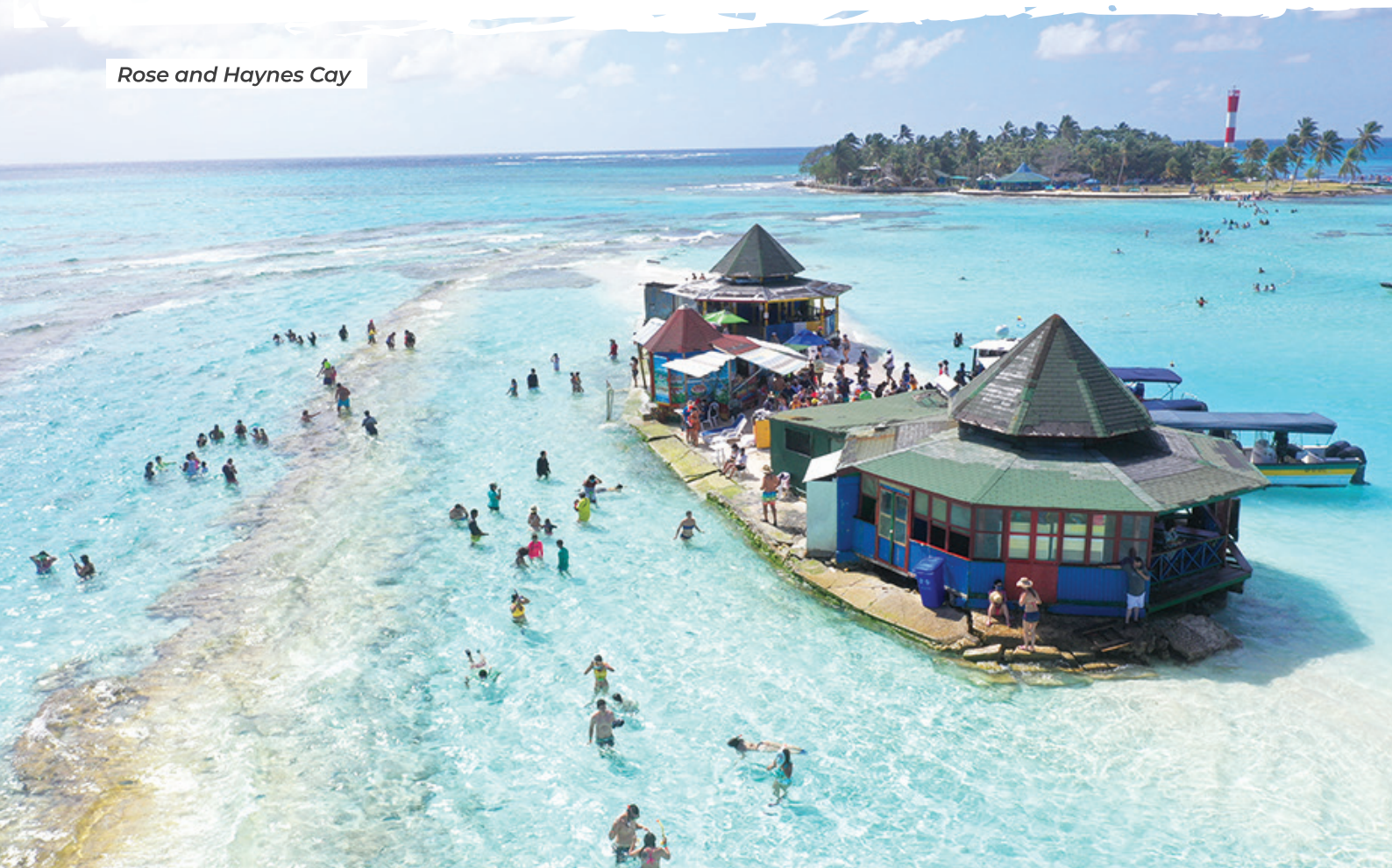
Rose and Haynes Cay

Además, a través de los Puntos de Información (PIT'S) pudimos coordinar a nivel nacional las pautas a seguir con los turistas confinados en los diferentes lugares para el regreso a su ciudad de origen. Identificamos y visitamos los sitios donde se encontraban hospedados alrededor de 800 turistas, que quedaron atrapados por el cierre del aeropuerto por causa de la pandemia en la isla de San Andrés, y 100 más en la hermana isla de Providencia.