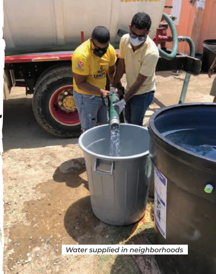
Water supplied in neighborhoods

During the preventive isolation period, the Institutional Program of the Departmental Administration was broadcast weekly by our Regional Channel Teleislas which was led by the Governor, Secretaries and a number of guests who officially reported on the status of Covid-19 in the Archipelago; the deliveries of food aid, the supply of water and the progress of the management, and general actions of the Government.