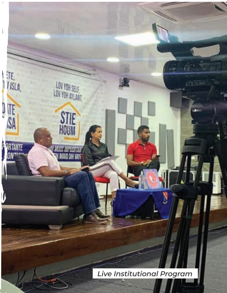
Live Institutional Program