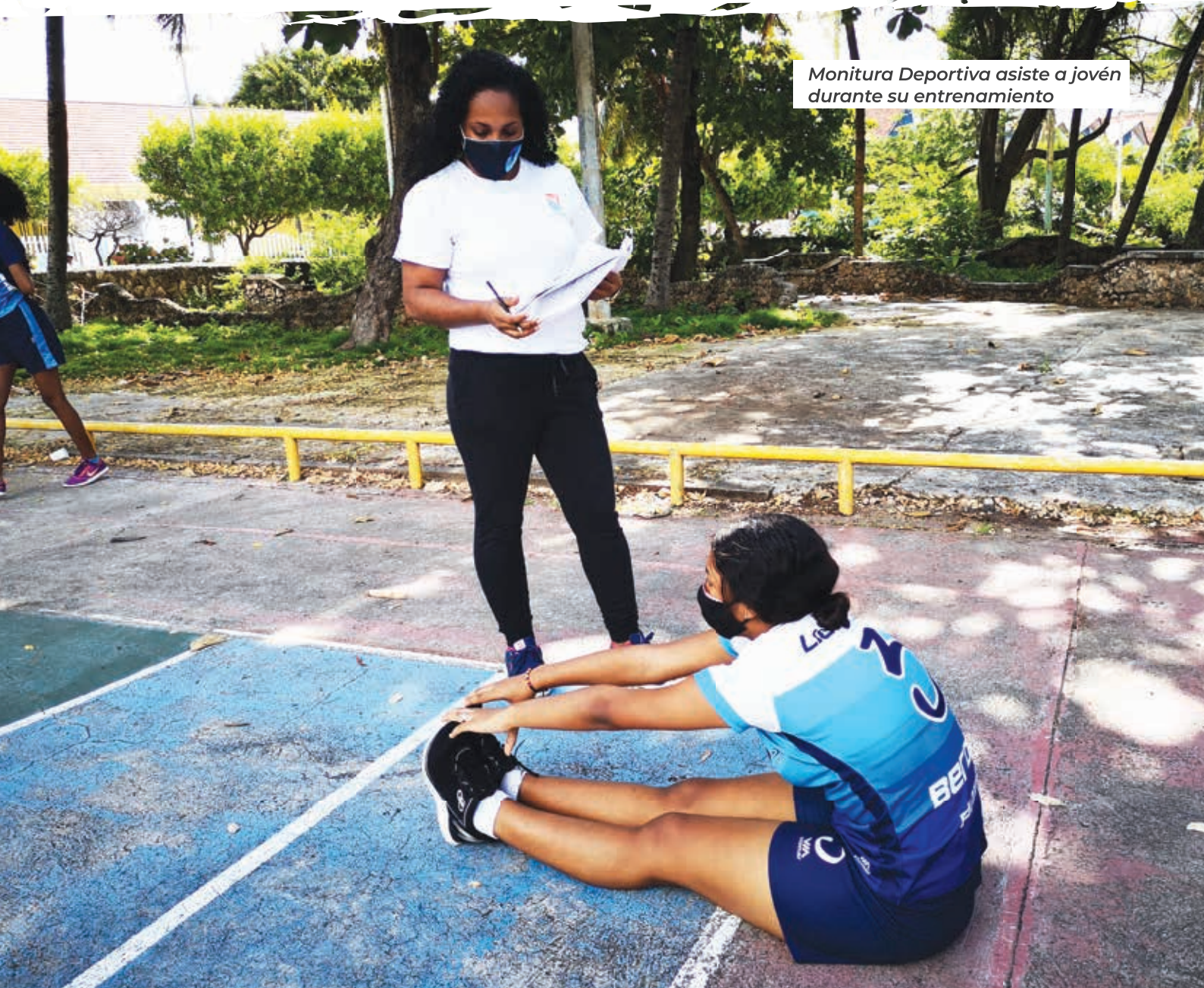
Monitora Deportiva asiste a joven durante su entrenamiento

La realización de videos con rutinas de actividad física para la población de las islas se realizó en articulación con la Oficina de Prensa y Comunicaciones del Departamento, publicados en la página de Facebook de la