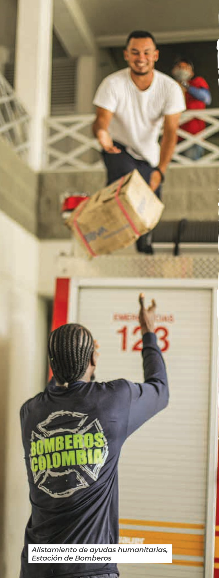
Alistamiento de ayudas humanitarias, Estación de Bomberos

Por otro lado, la llegada del huracán ETA produjo un número significativo de afectados que requirió la intervención del nivel nacional, quien delegó en el Ministerio del Interior la responsabilidad de implementar acciones de mejora para las islas. Las acciones implementadas para dar respuesta inmediata a estas afectaciones, fueron: 78 familias con abastecimiento de agua, entrega de 28 kits alimentarios nocturnos, 53 kits de mercados, 35 frazadas y 43 colchonetas.