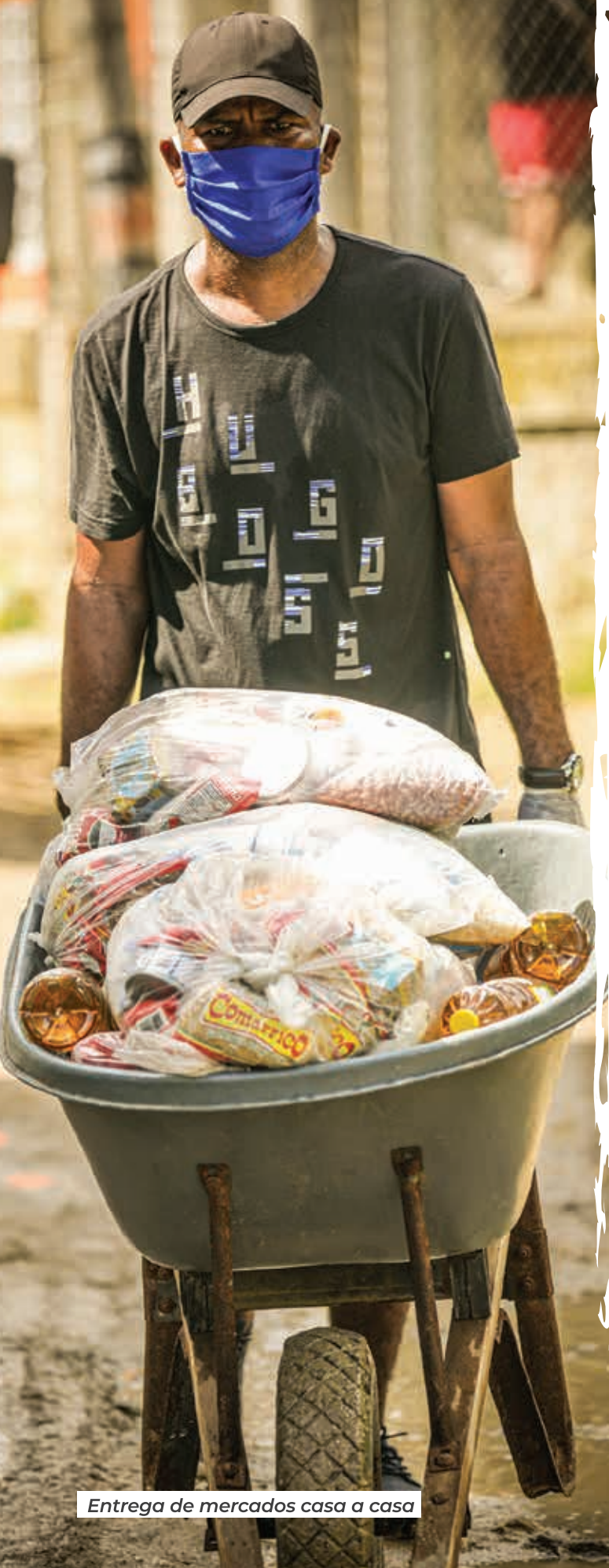
Entrega de mercados casa a casa

Además, se adelantaron los estudios y aprobación del proyecto de la Casa de la Mujer, los cuales se encuentran en su etapa de adecuación y cuya fecha de entrega depende del Plan de Desarrollo Departamental. Asimismo, gracias al acompañamiento de la Consejería Presidencial para la Equidad de la Mujer, y diálogos sostenidos con la Vicepresidencia de la República, se están adelantando las gestiones necesarias para avanzar en el proyecto de la Casa Refugio y la consecución de un espacio digno para ser adecuado, según los lineamientos de ley.