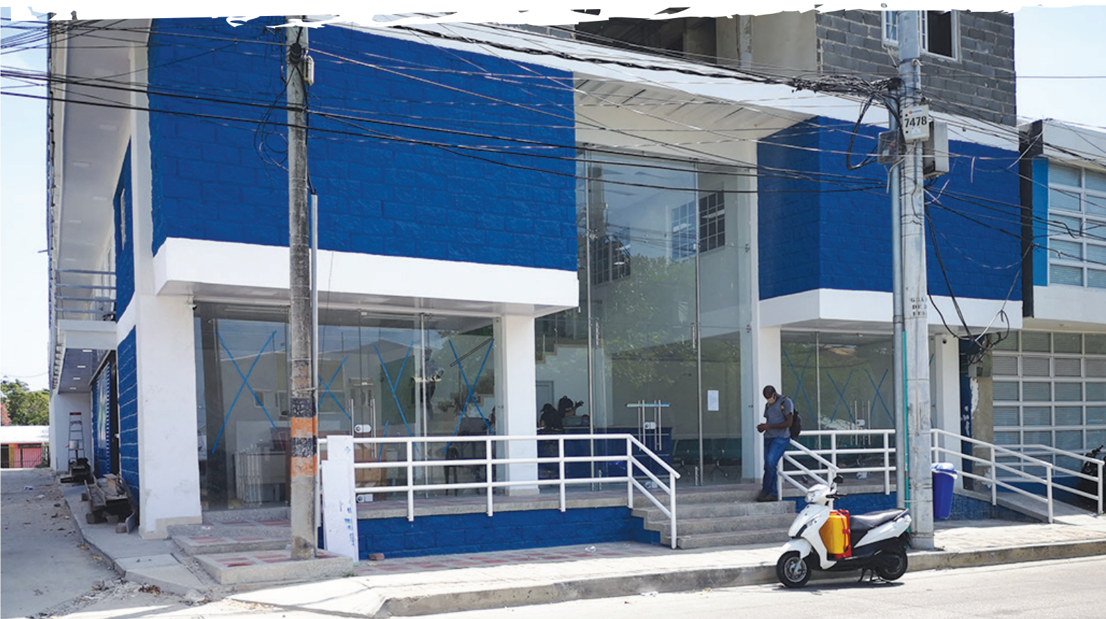
OCCRE Office, Av. 20 de Julio

To strengthen the entity, through the hiring area, a total of two hundred nine (209) people