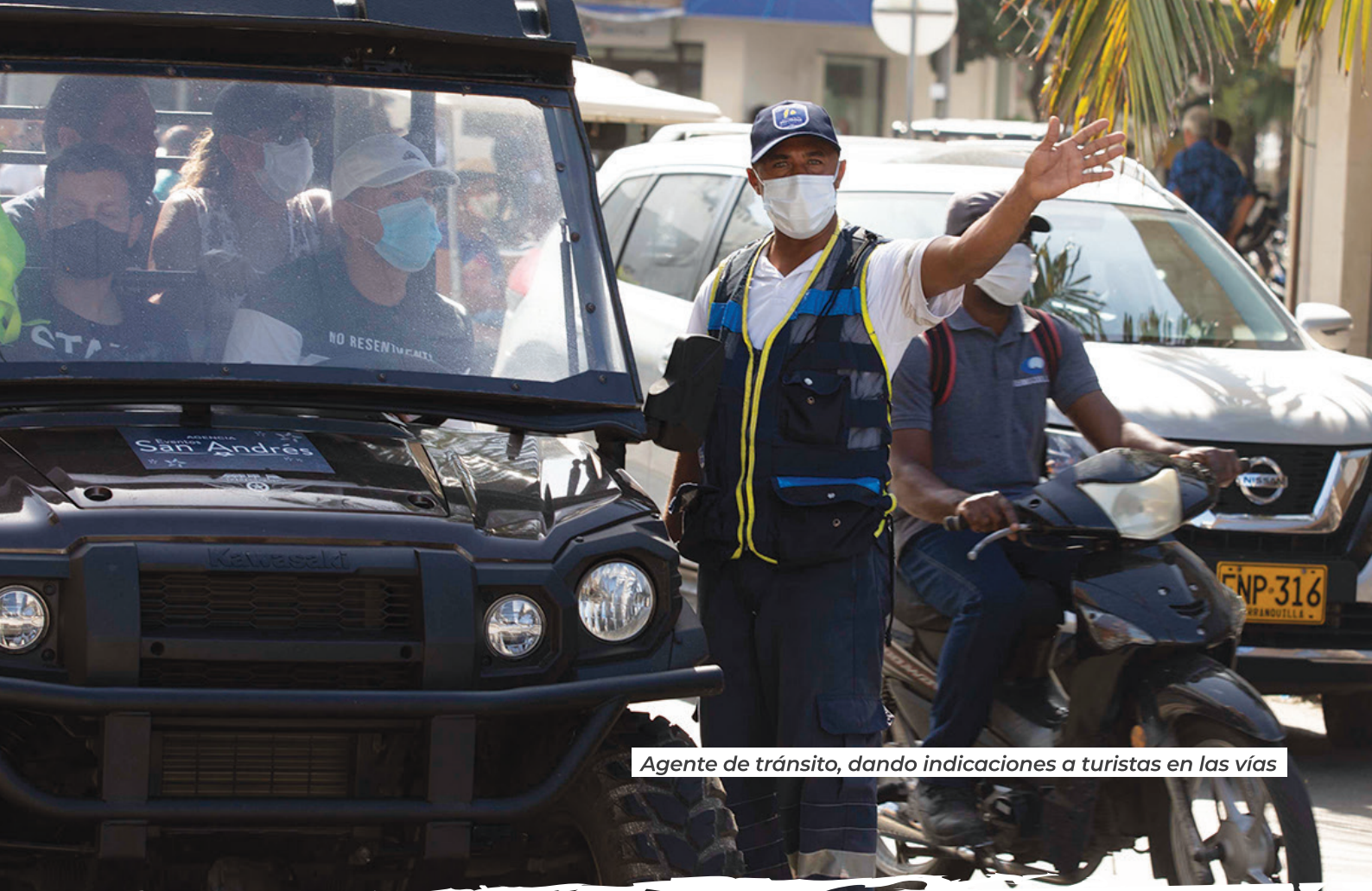
Agente de tránsito, dando indicaciones a turistas en las vías