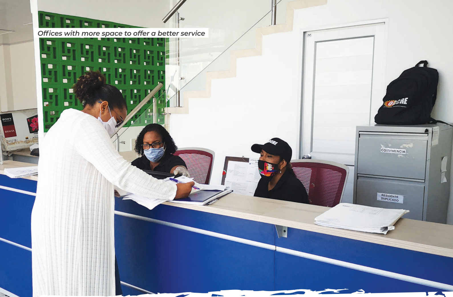
Offices with more space to offer a better service

The National Digital Agency declared to be an entity that does not have resources for implementation, but they carry out the accompaniment work in the search for funds for the fulfillment and development of the projects. The year ended with the commitment by National Digital Agency to send a proposal to the Administrative Director of the OCCRE, in order to start in 2021.